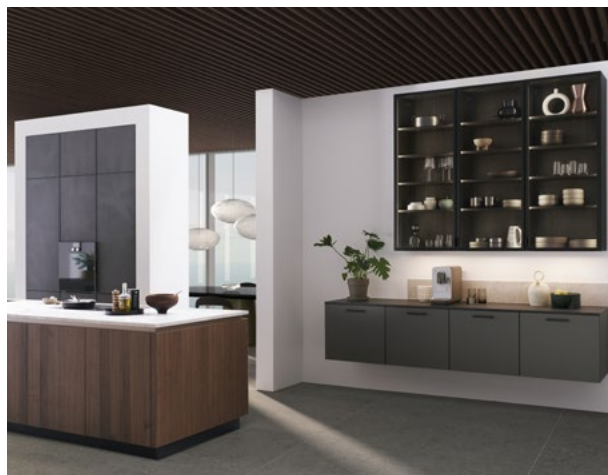
Les deux éléments muraux, positionnés librement, définissent des zones dans l'espace : à gauche une armoire haute fonctionnelle, à droite des meubles accueillants.