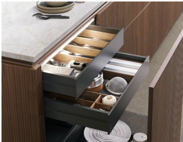
À l'intérieur des armoires de l'îlot, le design clair et épuré du châssis M8 en gris carbone maintient l'esthétique générale de qualité et de minimalisme.