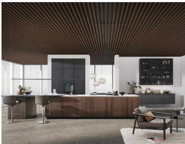
Avec une vision futuriste, LEICHT présente cet espace de vie ouvert au maximum avec une structuration visuelle et fonctionnelle claire.