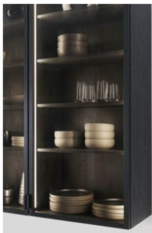
Les vitrines en verre éclairées VERO offrent la mise en scène parfaite de la vaisselle fine et des objets décoratifs.