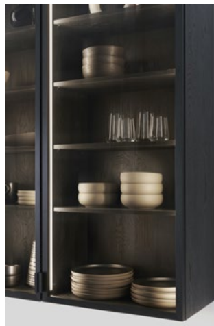
In de verlichte VERO-vitrinekasten komen mooi serviesgoed en decoratieve accessoires goed tot hun recht.