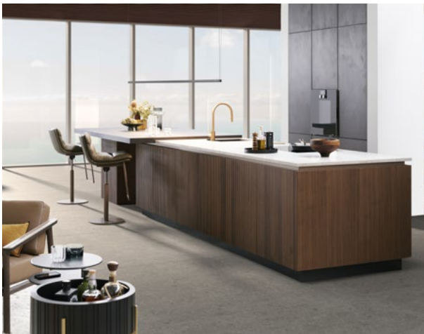
Het centrale kookeiland met echt houten front in BOSSA walnoot vormt in dit scenario het middelpunt voor gezellig samenzijn.