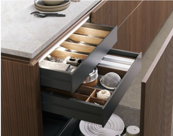
In de kasten van het kookeiland komt het hoogwaardige en minimalistische totaalbeeld terug in het strakke en slanke design van de M8 ladezijwand in carbongrijs.