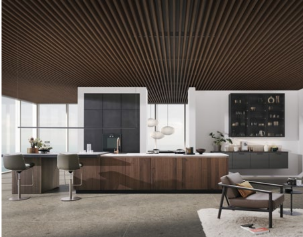
LEICHT illustreert hier toekomstgericht een maximaal geopende leefruimte met een optische en functionele indeling in zones.