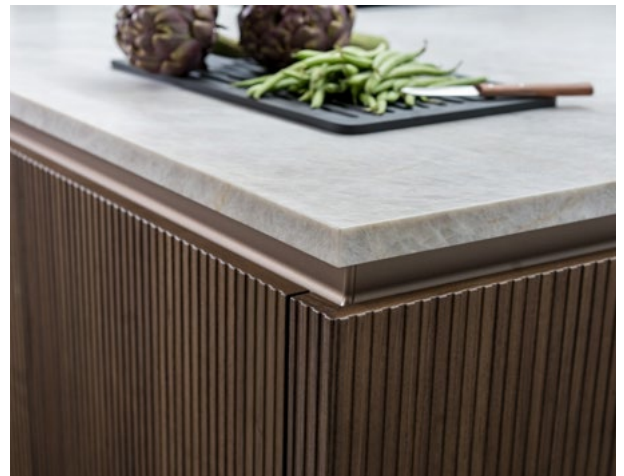
Harmonieuze materiaalcompositie: terwijl het notenhout van BOSSA warmte uitstraalt, voegt het natuursteen ROCCA in taj mahalsanded een koelere uitstraling toe.