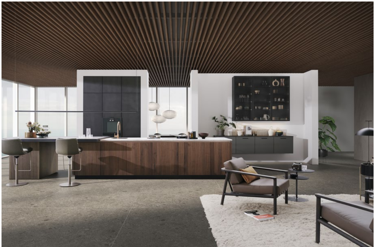
De combinatie van de LEICHT-series BOSSA walnoot, ROCCA taj mahal sanded en CONCRETE brasilia zorgt voor een harmonieuze materiaal- en kleurencompositie.

In het middelpunt en als centrum van het dagelijks leven ontworpen staat in dit ontwerp een greeploos kookeiland met geïntegreerde zitgelegenheid. De succesvolle serie BOSSA met echt houten fronten in walnoot zorgt hier voor de bijzondere structuur. Het reliëf met stroken van het meermaals bekronde BOSSA-front zorgt voor een warm, gelijkmatig totaalbeeld en geeft de keuken een driedimensionaal en heel levendig effect. Een bewuste keuze in het ontwerp om zowel een elegant als speels effect te creëren. In combinatie met een natuurstenen werkblad uit de LEICHT-serie ROCCA en daarachter liggende, op zichzelf staande wandelementen met geïntegreerde functie- en woongedeelten, ontstaat een visionair scenario, dat enerzijds inzet op duurzame, hoogwaardige materialen en anderzijds een gevoel van thuis overbrengt.