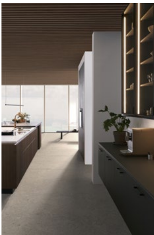
Een inrichting met visie: in de ruimte die aan alle kanten open is, genieten de bewoners van de vrijheid voor persoonlijke ontwikkeling.