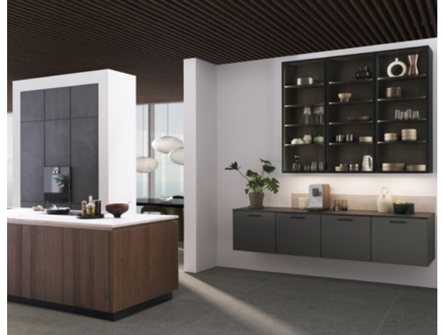
De twee vrij in de ruimte geplaatste wandelementen zorgen voor structuur: links met functionele hoge kast, rechts met sfeervol meubilair.